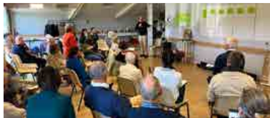
Assemblée générale Saint-Paul-en-Baugeois à Beauvau.

L'EAP de chaque paroisse est constituée de prêtres et de laïcs. Elle a reçu mission de l'évêque de conduire l'action pastorale de la paroisse. Elle le fait en étant à l'écoute des besoins exprimés par les chrétiens, notamment lors des assemblées paroissiales, et en cherchant à mettre en œuvre les orientations missionnaires choisies en lien avec celles du diocèse.