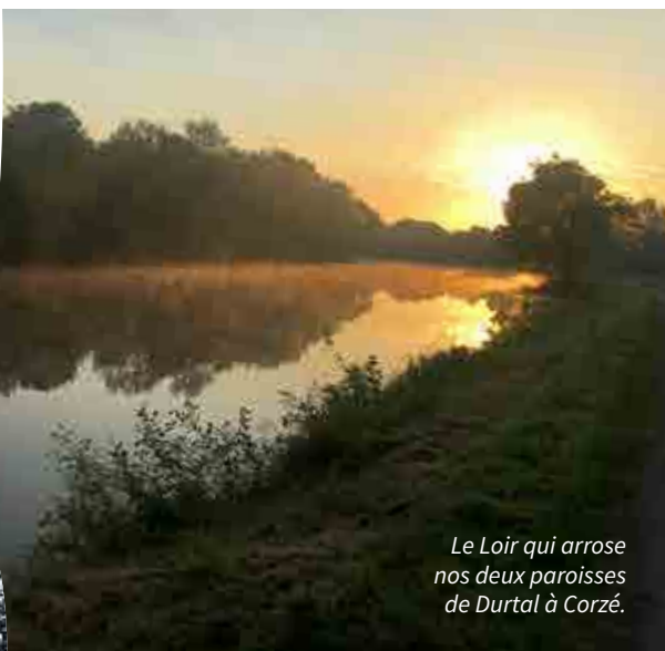
Le Loir qui arrose nos deux paroisses de Durtal à Corzé.