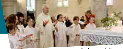
Profession de Foi.