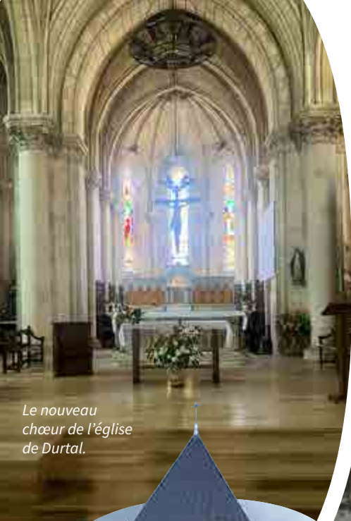
Le nouveau chœur de l'église de Durtal.

SAINT-PAUL-EN-BAUGEOIS ET NOTRE-DAME-DU-LOIR