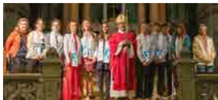
Confirmation avec Mgr Delmas.

Contact : un des prêtres ou aux permanences au presbytère.